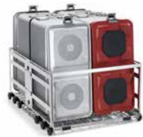
CARRO DE LAVAGEM DE ANESTESIA