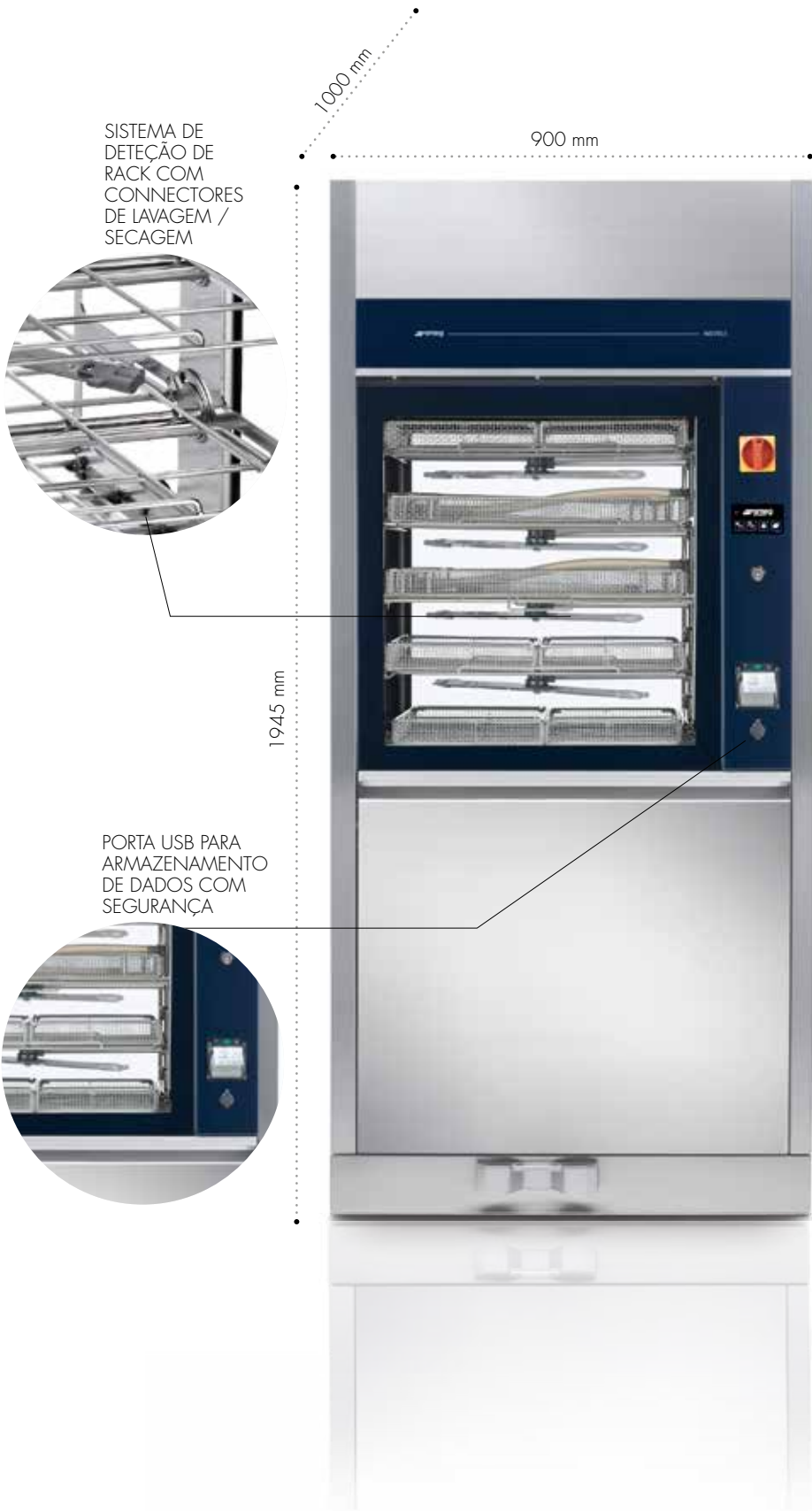
ROBOTIC/DA VINCI LAVAGEM

Desinfecção com porta deslizante simples ou dupla. A última geração de eletrónica com tecnologia de ecrã tátil, garante desempenhos irrepreensíveis. Capacidade: até 18 cestos DIN. Possibilidade ciclo de desinfecção térmica TURBO de 35 MINUTOS.