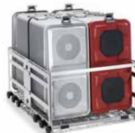
LAVAGGIO SET DI ANESTESIA